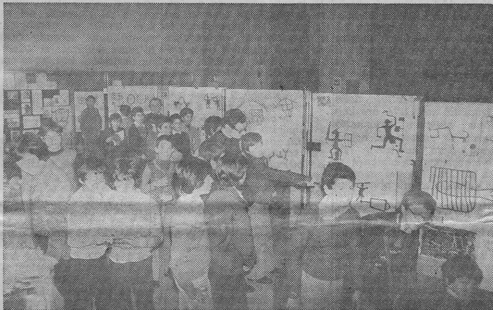
Un gruppo di studenti in visita alla mostra allestita dai ragazzi della Pascoli

Alla scuola Pascoli gli alunni della classe 1 a C e 1 a G hanno allestito una mostra didattica dal titolo « Leggiamo... i Camuni ». Attraverso una serie di tavole, alcune stampate dal Centro studi camuni, alcune preparate da alunni di altre classi, è possibile studiare la storia e la vita dei Camuni, i loro usi e costumi, la religione, l'economia, le abitazioni e così via. E' pure dato particolare rilievo alle tecniche usate