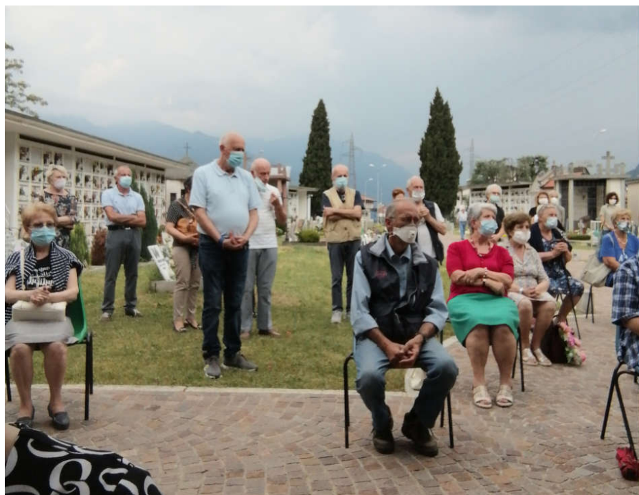
1 luglio 2020 - commemorazione al cimitero di Corti di Costa Volpino.